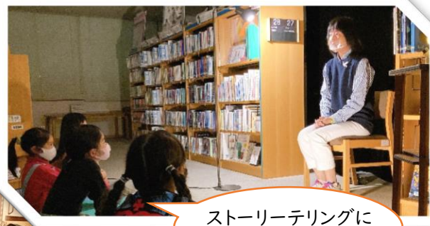
ストーリーテリングに わくわくドキドキ