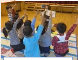
元気な吉和っ子たち。

読書の秋、図書館ではたくさんのイベントがありました。久しぶりに見る子どもたちの笑顔です。本やおはなしが好きな子ばかり、楽しい時間を過ごしました♪