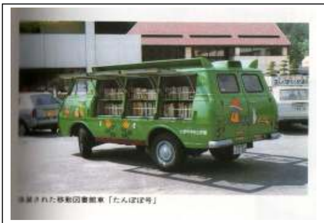
2 代目の移動図書館車には、こんな絵がっていました。