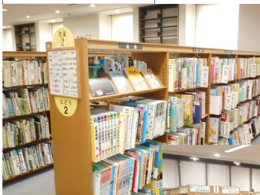
児童コーナーの棚

1月23日(月)~2月3日(金)の特別整理期間中に、旧大野図書館施設から書棚を運んで来て、児童コーナーと一般文学の書棚(※一部を除く)を入替えました。