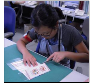
本に透明なカバーをつけています

また、中学生たちは毎朝おすすめの本を1冊ずつ持って来てみんなに紹介したり、10月の中央展示（展示期間：9月25日～10月21日）のテーマを考えて、資料を集めたりしました。