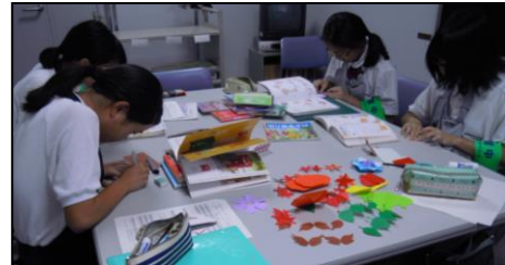
展示の準備をしています