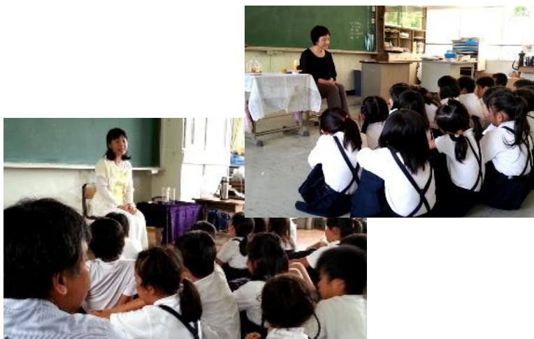
これらの本の中からおはなしを語りました。

その「おはなしたまてばこの会」は、2012年秋から図書館を飛び出して、廿日市市内の小学校を訪問しています。回数を重ねるごとに希望校が増え、2014年7月までに24校86回にわたりおはなしを届けました。今後も多くの子どもたちにおはなしを通して、ことばが持つ力、想像することの楽しさを伝えていきたいと思っています。